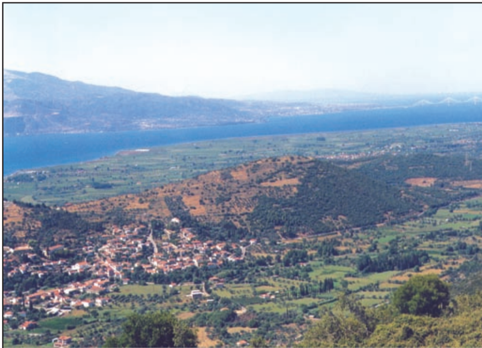
Η παραλιακή ζώνη του Δήμου Ευπαλίου με το αποχετευτικό λύνει ένα σημαντικό πρόβλημα για την σωστή ανάπτυξη της περιοχής

Ελπίζουμε με τις κατάλληλες ενέργειες όλων το τόσο σημαντικό αυτό έργο για την περιοχή μας να εκτελεστεί μέσα στις προβλεπόμενες ημερομηνίες.