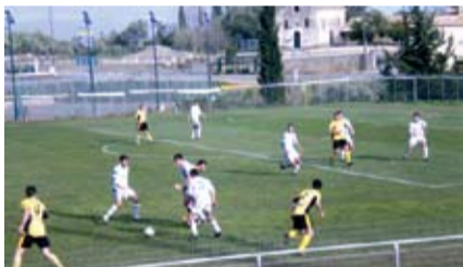
Γυρολόγοι οι παίκτες του Απόλλωνα στα γήπεδα της Δυτικής Ελλάδας παλεύουν με αξιοπρέπεια για τη φανέλα και την ιστορία της ομάδας.