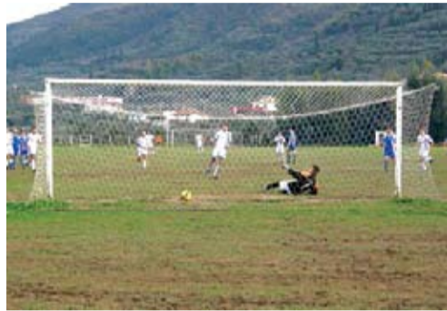
Ο σπεσιαλίστας των πέναλτι Γιώργος Φλέγκας επιτυγχάνει ένα ακόμα γκολ

Όπως γίνεται αντιληπτό, το κλίμα στις τάξεις του Απόλλωνα δεν είναι καθόλου καλό, κάτι που φαίνεται πλέον και από τα λε-