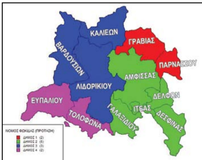
Η πρόταση του Ινστιτούτου Τοπικής Αυτοδιοίκησης και της Τ.Ε.Δ.Κ. Φωκίδας για τη δημιουργία 4 Δήμων από τους 12 που έχει σήμερα η Φωκίδα.

Δωρίδα. Εδώ «άρχισαν τα όργανα» και ο κάθε παράγοντας ανάλογα από την σκοπιά που βλέπει το πράγμα κάνει προτάσεις και ασκεί πιέσεις προς κάθε κατεύθυνση. Έτσι κατ' αρχάς να πούμε ότι τα Δημοτικά Συμβούλια του Ευπα-