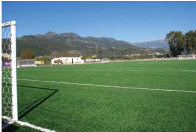
Το γήπεδο του Ξηροπηγάδου παρότι είναι έτοιμο ουσιαστικά δεν μας επιτρέπουν για μικροσκοπιμότητες, να αγωνιστούμε σε αυτό. Κι έτσι η ομάδα το χρησιμοποιεί μόνο για προπονήσεις.

περιμένουμε από το καλοκαίρι να δημοπρατηθεί και η υπόθεση έχει παραμείνει στάσιμη. Εμείς δεν μπορούμε να κάνουμε κάτι