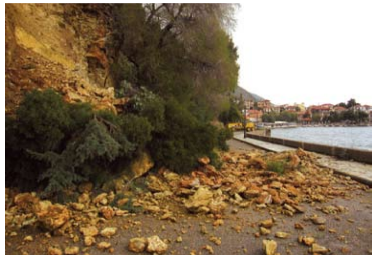
Έκλεισε ο δρόμος Μοναστηρακίου-Παραθάλασσου και αν δεν γίνουν σοβαρά έργα υποδομής δύσκολα θα πάρει κανείς απόφαση να τον ανοίξει.

Εκτοτε οι μικροσεισμοί ήταν συνεχείς για μεγάλο χρονικό διάστημα, έτσι που όπως είπε κάποιος κάτοικος «η γη έβραζε κάτω από τα πόδια μας». Κι αυτό βέβαια γιατί όπως αναφέραμε το επίκεντρο ήταν στη περιοχή του Δήμου