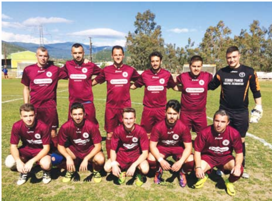
Η ομάδα των τελευταίων αγώνων

«Είχαμε την ευκαιρία να ξεκουράσουμε κάποιους άλλους. Τώρα δεν την έχουμε. Το οικονομικό σκέλος είναι μεγάλος βραχνάς. Τα πράγματα είναι πολύ δύσκολα και του χρόνου θα είναι ακόμη πιο δύσκολα, αλλά αυτό είναι μία άλλη συζήτηση που θα γίνει το καλοκαίρι. Εγώ από την πλευρά μου θέλω να ευχαριστήσω όλα τα παιδιά που ακολούθησαν την ομάδα μέχρι