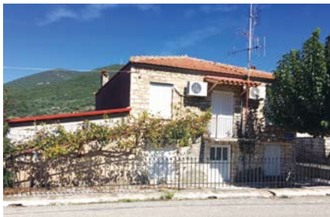
Το πατρικό σπίτι του Γ. Τσουκαλά στο Ευπάλιο

Η κατάσταση στη θάλασσα έχει βελτιωθεί σημαντικά, σύμφωνα με τις ανακοινώσεις των αρμόδιων Υπουργείων και σε δύο σημεία της είναι κατάλληλη για κολύμβηση. Ήδη πολλοί κάτοικοι κολυμπούν, ανάμεσά τους και εγώ. Φυσικά δεν πιστεύουμε ότι