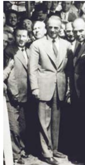
Με τον Κωνσταντίνο Καραμανλή στα εγκαίνια του εργοστασίου λιπασμάτων το 1963 στην Πτολεμαίδα.

είχε μειωθεί, η δε Ένωση έκλεισε, πάντα οραματιστής και ανήσυχος, έλεγε για την μεγάλη πέτρινη αποθήκη με λιπάσματα και αγροτικά προϊόντα στο κέντρο του Ευπαλίου. "Ό,τι πρόσφερε για τα χωράφια μας τα πρόσφερε. Τώρα να την αξιοποιήσετε, να προσφέρει για πολιτιστικές δραστηριότητες"! Ο ίδιος μου εκμυστηρεύτηκε στο τέλος της πορείας του λίγο πριν φύγει. "Η μεγάλη πρόκληση για το Ευπάλιο είναι η ανάδειξη του αρχαιολογικού του χώρου. Στην Ακρόπολη (λόφος του Γύρου) υπάρχουν τμήματα του κάστρου της αρχαίας πόλης που τελευταία αναδείχθηκαν ακόμα περισσότερο από έρευνα και μελέτες του αείμνηστου μηχανικού Αντώνη Παπαϊωάννου. Επίσης τη δεκαετία του '60 στα πρηνή του λόφου δεξιά όπως ανεβαίνουμε το δρόμο προς Μοναστηράκι, μεταξύ «βρύσης Πλατάνια» και "Κτίρια Αγ. Παρασκευής" από εργασίες (ξελακώματα) που έκανε αγρότης στο χωράφι του, αναδείχθη-