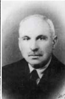
ο Αθανάσιος Παπανικολάου