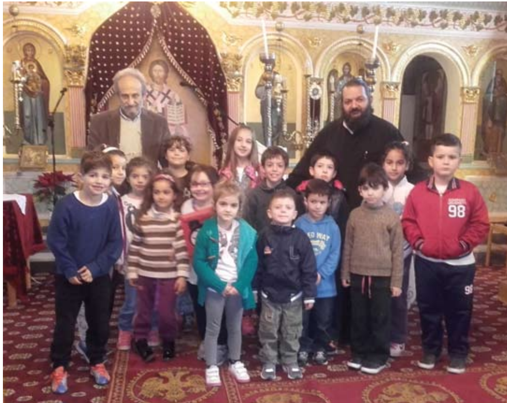
σπίτια μας, με τα αγαπημένα μας πρόσωπα και με ευχές για μια καλή χρονιά με Υγεία-Αγάπη-Ευτυχία.