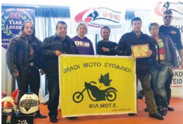
Μέλη του ΦΙΛΜΟΤΕ στην εκδήλωση της ΑΧΛΕΜΟΤ στην Πάτρα

κ.α., και γρήγορα δημιουργήθηκε μια ζεστή συναδελφική, οικογενειακή ατμόσφαιρα.