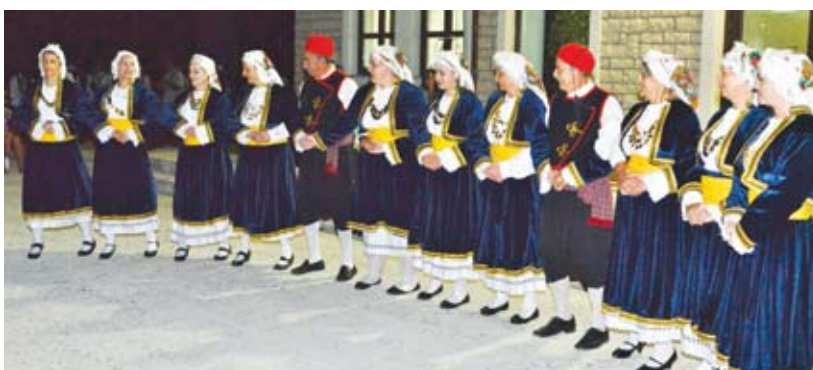
Το χορευτικό τμήμα του Πολιτιστικού Συλλόγου Τολοφώνας.