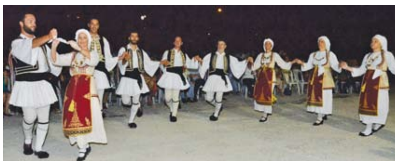
Ο Χορευτικός Όμιλος Άμφισσας του Πολιτιστικού Κέντρου Φωκίδας

μένων τοποθετημένων σ'ένα χώρο, όσο καλά κι αν είναι διευθετημένα. Το μουσείο είναι χώρος επικοινωνίας των εκθεμάτων με το ευρύ και μη ειδικό κοινό, που μπορεί να προσφέρει εκπαιδευτικά προγράμματα με ευχάριστο και βιωματικό τρόπο για όλες τις ηλικίες..... Το Λαογραφικό Μουσείο Ευπαλίου, που αποτελεί ανεκτίμητη προσφορά στη μι-