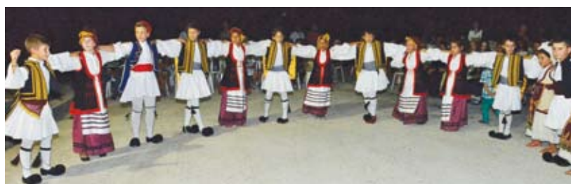
Το παιδικό χορευτικό τμήμα του Πολιτιστικού Συλλόγου Ευπαλίου.