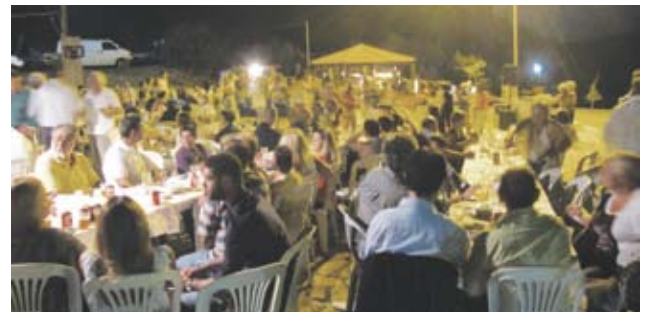
Από την ωραία εκδήλωση στο Τρίγωνο Πευκακίου

οποιοδήποτε τρόπο βοήθησαν στην μεγάλη επιτυχία της εκδήλωσής μας και όλους όσους τίμησαν με την παρουσία τους την εκδήλωσή μας αυτή. Στις 30 Αυγούστου γιορτάσαμε τη γιορτή του Αγίου Αλεξάνδρου στο νέο Νεκροταφείο του χωριού μας με τέλεση θείας λειτουργίας μετ' αρτοκλασίας και με αυτή κλείσαμε τις καλοκαιρινές μας εκδηλώσεις.