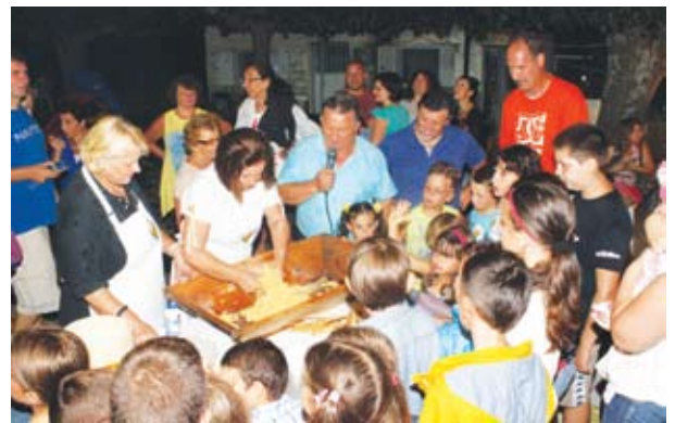
Η γιορτή του καλαμποκιού μάγεψε τους μικρούς φίλους.

Το βράδυ της ίδιας ημέρας πραγματοποιήσαμε τη μεγάλη εκδήλωση, τη