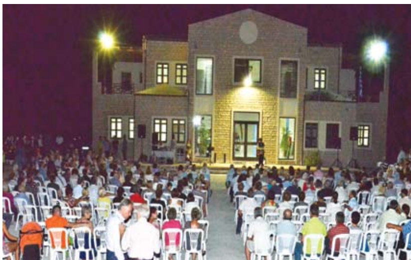
Μερική άποψη με την πολυπληθή παρουσία στην εκδήλωση

Η ύπαρξη και λειτουργία ενός εθνογραφικού μουσείου θα μπορούσε να θεωρηθεί ως αυτοσκοπός καθώς συγκεντρώνει, διασώζει, συντηρεί, μελετά και προβάλλει τα έργα του ανθρώπου στη μακρά διάρκεια. Τα οποιαδήποτε, ωστόσο, μουσεία καθίστανται χρήσιμα μόνον όταν αξιοποιούνται. Και αξιοποιούνται μόνον αν έχουν γίνει γνωστά στο κοινό και αν το κοινό μπορεί να αντιληφθεί την σημασία των εκθεμάτων, μέσα από μουσειογραφικές πρακτικές προσαρμοσμένες στις ανάγκες του. ....Το μουσείο είναι ένα «ίδρυμα στην υπηρεσία της κοινωνίας». Πρόκειται πράγματι για μια επανάσταση σε πολλούς τομείς, σε σύγκριση με την παραδοσιακή μουσειολογία. Η σύγχρονη, λοιπόν, μουσειολογία βασίζεται σε μια διευρυμένη αντίληψη του μουσειακού κοινού και των καθηκόντων του μουσείου απέναντί του. Οι σχέσεις επίσης μουσείου, κοινωνίας και φύσης είναι σήμερα βασικότατος παράγων. Η στροφή στην οικολογία και η μουσειολογική επέκταση με τη δημιουργία φυσικών και πολιτισμικών πάρκων είναι αναγκαία για την καλλιέργεια της σχέσης του κοινωνικού συνόλου με τη φύση και τη σφαιρική της θεώρηση και μελέτη. Ιδιαίτερα για μουσεία, που αναφέρονται στον γεωργοκτηνοτροφικό βίο η σύνδεση με το περιβάλλον είναι αναγκαία. Μουσείο δεν είναι ένας αριθμός αντικει-