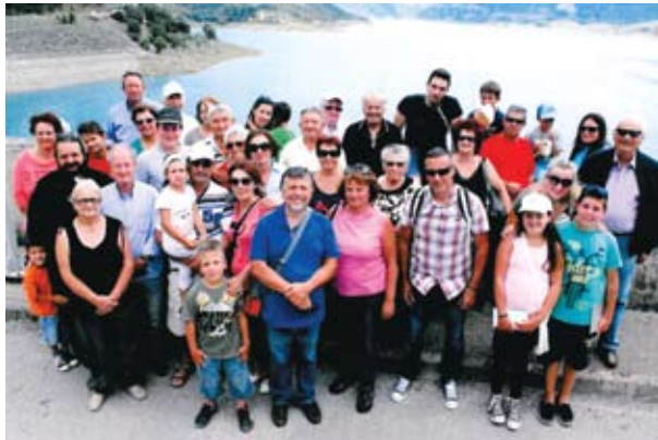
Από την εκδρομή του Συλλόγου στο Φράγμα.

ηθεί καθόλου. Επειδή όμως υπήρχε κίνδυνος να αυτοκαταργηθεί, αποφασίστηκε να πραγματοποιηθεί στις 31 Ιουλίου, έστω και με λίγα άτομα