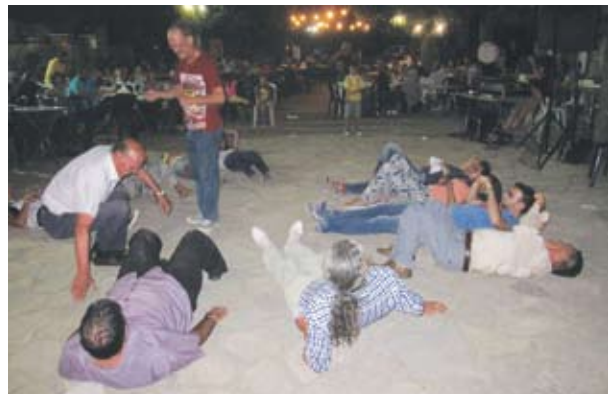
“Πως το τρίβουν το πιπέρι» και η... λουριδα ανεμιζει.

Στις 12 Αυγούστου πραγματοποιήσαμε τη γιορτή του καλαμποκιού. Όπως έχουμε γράψει πολλές φορές η γιορτή αυτή είναι τοπική και συμβολική και αποσκοπεί στο να μάθουν τα παιδιά πώς ψήνονται τα καλαμπόκια και πώς είναι ημπομπότα με την οποία μεγάλωσαν οι πρόγονοί τους,