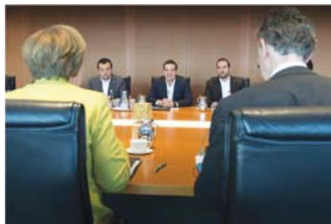
Ο Δημήτρης Τζανακόπουλος δίπλα στον Αλέξη Τσίπρα στο τραπέζι των συζητήσεων με την Καγκελάριο Μέρκελ