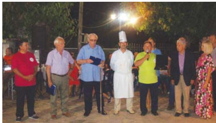
Ο Σύλλογος στην εκδήλωση της φασολάδας τίμησε συγχωριανούς για τη μεγάλη προσφορά τους.

Ευχόμαστε σε όλους αυτούς καλό χρέμονα και να ξανάβρετε του χρόνου αν μείνατε ευχαρι- στημένοι. Καλή αντάμωση. Στις 30/8 γιόρταζε κι άλλο Νεκροταφείο, στο Πευκάκι και τελέστηκε Θεία Λειτουργία από τρεις Ιερείς μετ' αρ- τοκλασίας.