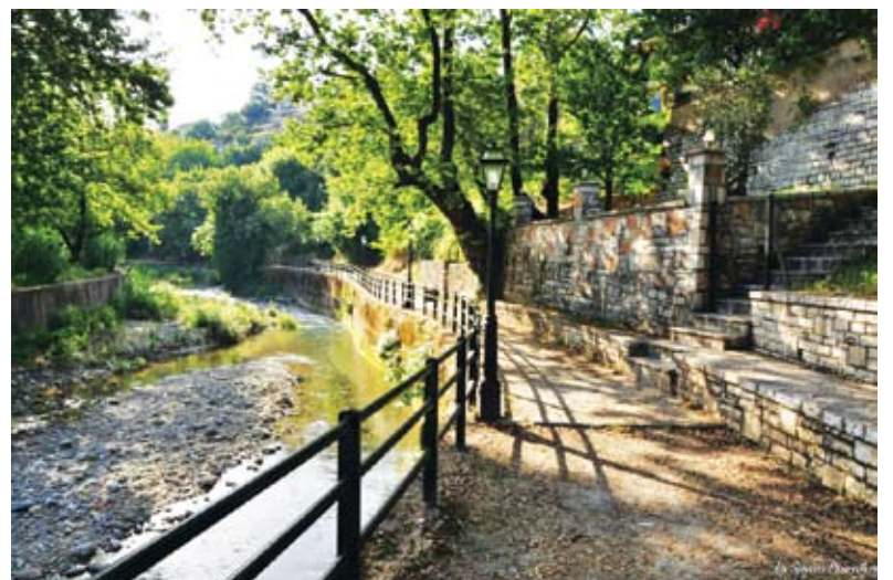
Αριστερά το έργο-έκτρωμα που πάνε να στήσουν, αντί για σκάλες, στο δρόμο που οδηγεί από την εκκλησία του Αη-Γιώργη στο δρόμο (φωτό δεξιά) περιπάτου δίπλα στη Μαντήλω.

“Πολλοί το χαρακτήρισαν ως έκτρωμα του Ευπαλίου και άλλοι ως έγκλημα στο φυσικό του περιβάλλον. Εμείς θα το πούμε απλά με τα λόγια του περίφημου διπλωμάτη και πολιτικού Μέτερνιχ... « Αυτό δεν είναι έγκλημα. Είναι λάθος». Πρόκειται για το έργο διάνοιξης του δρόμου από τον Αϊ-Γιώργη προς τη