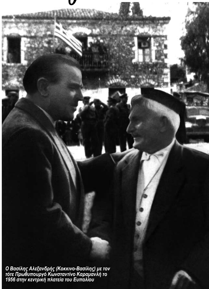
Ο Βασίλης Αλεξανδρής (Κοκκινο-Βασίλης) με τον τότε Πρωθυπουργό Κωνσταντίνο Καραμανλή το 1956 στην κεντρική πλατεία του Ευπαλίου

προκύπτει από τα πιστοποιητικά αγωνιστικότητας που υπάρχουν στα Γενικά Αρχεία του Απελευθερωτικού Αγώνα (1821 – 1829).