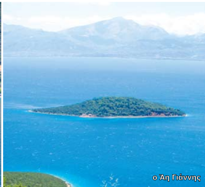
ο Άη Γιάννης