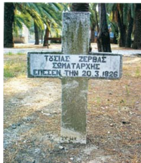
Ο τάφος του Τούσια Ζέρβα στον κήπο των ηρώων του Μεσολογγίου

το 1802. Έλαβαν μέρος και τα πέντε στην επανάσταση του 1821. Όπως προκύπτει από τις αιτήσεις και τα πιστοποιητικά αγωνιστικότητας έλαβαν μέρος σε πολλές μάχες στη Ρούμελη, Μεσολόγγι και Πελοπόννησο. Μετά την απελευθέρωση πήραν αντί χρηματικής αμοιβής εθνικές γαίες (χωράφια) στην κοιλάδα του Ευπαλίου και τη γύρω περιοχή. Εγκαταστάθηκαν αρχικά στην Καρυά και μετά κατέβη-