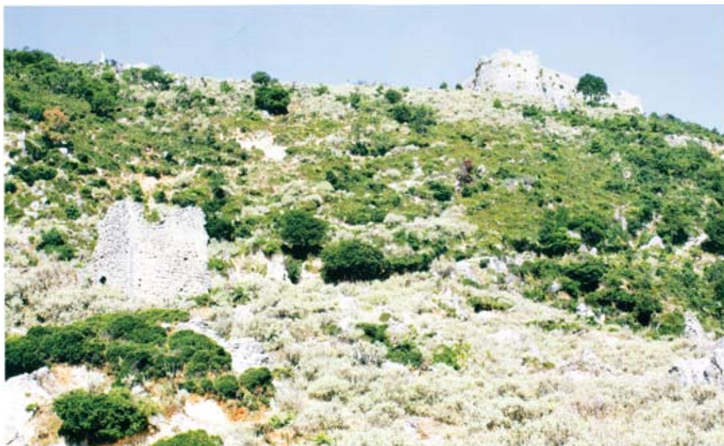
Αριστερά τα ερείπια του σπιτιού των Ζερβαίων στην Κιάφα Σουλίου και στην κορυφή το κάστρο της Κιάφας

Επίσης θα μπορεί ο καθένας από διηγήσεις ή άλλες πληροφορίες να αναφέρει άγνωστα ντοκουμέντα από τη ζωή και τη δράση των προγόνων του. Δίπλα στο όνομα θα γράφεται εντός παρενθέσεως το όνομά του/της συζύγου καθώς και το ψευδώνυμο για καλύτερο εντοπισμό.