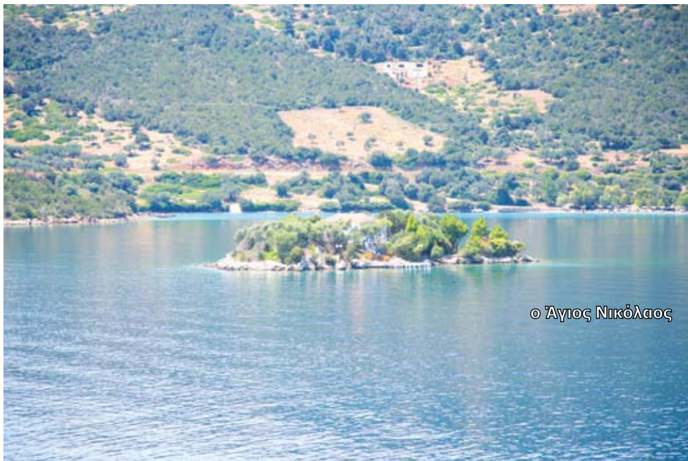
ο Άγιος Νικόλαος