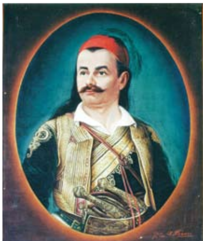
Νικόλαος Ζέρβας σε νεαρή ηλικία. (Προσωπογραφία. Εθνικό Ιστορικό Μουσείο)

γοράσει οπλαρχηγούς από το Σούλι. Έστειλε μεσολαβητές στον οπλαρχηγό Τζήμα Ζέρβα με σκοπό να εξαγο-