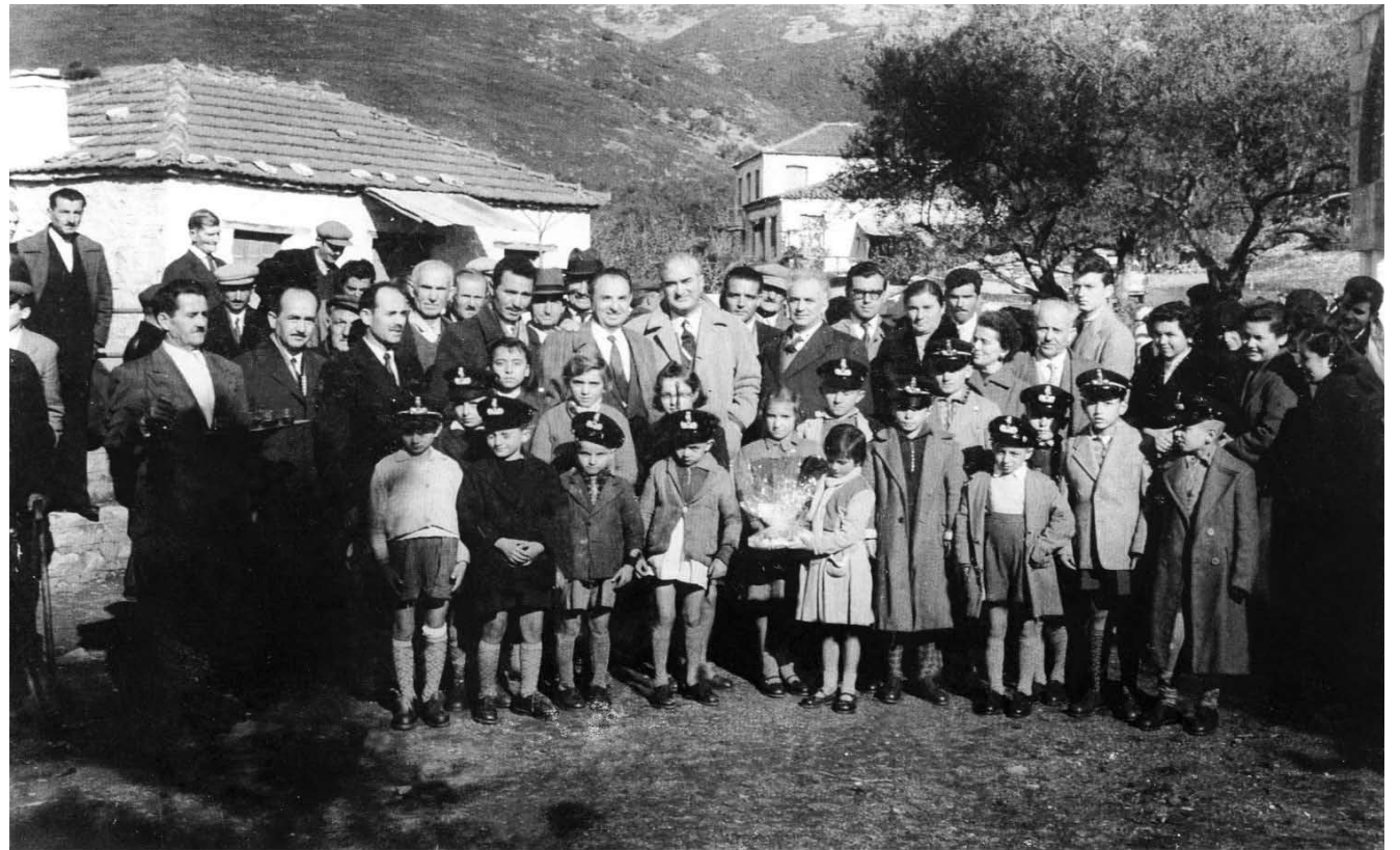
ΠΕΥΚΑΚΙ (ΠΑΛΙΟΧΑΝΟ) 21 ΜΑΪΟΥ 1956 - ΑΓΙΟΥ ΚΩΝΣΤΑΝΤΙΝΟΥ & ΕΛΕΝΗΣ