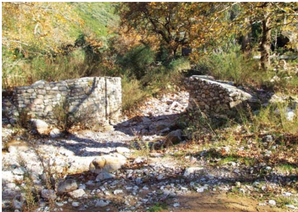
Το σημείο του χείμαυρου στον Αϊ-Γιάννη που διαμορφώθηκε για την τοποθέτηση της μικρής γέφυρας ώστε να περνάμε χωρίς κίνδυνο μέσα από τις πέτρες και τα νερά.

πιστούς και ιδιαίτερα των μεγαλύτερων ηλικιών, αλλά και πάλι μετά από μηνυτήριες παρεμβάσεις της προηγούμενης δημοτικής αρχής το έργο σταμάτησε και η γέφυρα που