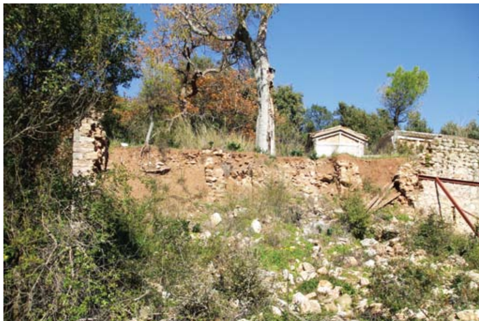
Σκόρπιες πέτρες από τη μάντρα που στήριζε τον Αϊ-Γιάννη. Αν αργήσουμε μπορεί και το μνημείο του Αϊ-Γιάννη να γίνει πέτρες που θα κυλήσουν στον παρακείμενο χείμαρρο

Στη συνέχεια, ξεπερνώντας τις αντιπαραθέσεις που υπήρξαν τα τελευταία χρόνια με το Ηγουμενοσυμβούλιο της Μονής Βαρνακόβης για τα ιδιοκτησιακά και λειτουργικά θέματα του ναού, συναντηθήκαμε από το καλοκαίρι δύο φορές με την Ηγουμενή και βάλαμε μπροστά τον κοινό στόχο, όλοι μαζί να σώσουμε το Ναό, γιατί τελικά δεν ωφελεί η στείρα αντιπαρά-