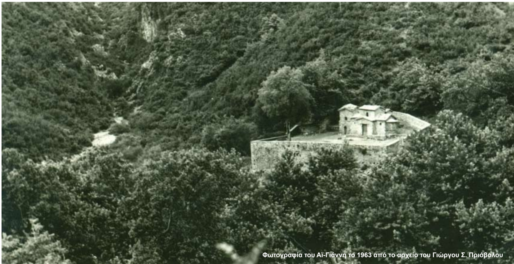
Φωτογραφία του Αϊ-Γιάννη το 1963

θεση περί του ιδιοκτησιακού. Ιδιοκτήτης ουσιαστικά είναι οι πολίτες του Ευπαλίου και της Δωρίδας.