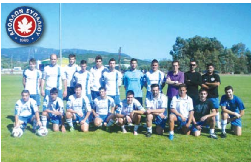
Το ρόστερ του Απόλλωνα Ευπαλίου της περιόδου 2012-2013 που θα εμπλουτιστεί και με νέα παιδιά από την περιοχή για τη νέα σεζόν.

ξεχωρίσει μακάρι να διακριθεί. Ήδη κάποια δοκιμάζονται στον Αστέρη Τρίπολης. Στο αγωνιστικό κομμάτι, ο κορμός θα μείνει. Αυτοί που έχουν