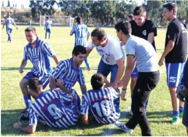
Παίχτες του Απόλλωνα πανηγυρίζουν μετά από ένα νικηφόρο αγώνα.

Σημαντική και η πορεία της Ένωσης Γλυφάδας που πραγματοποίησε εξαιρετικές εμφανίσεις αφήνοντας πολλές υποσχέσεις για τον δεύτερο γύρο.