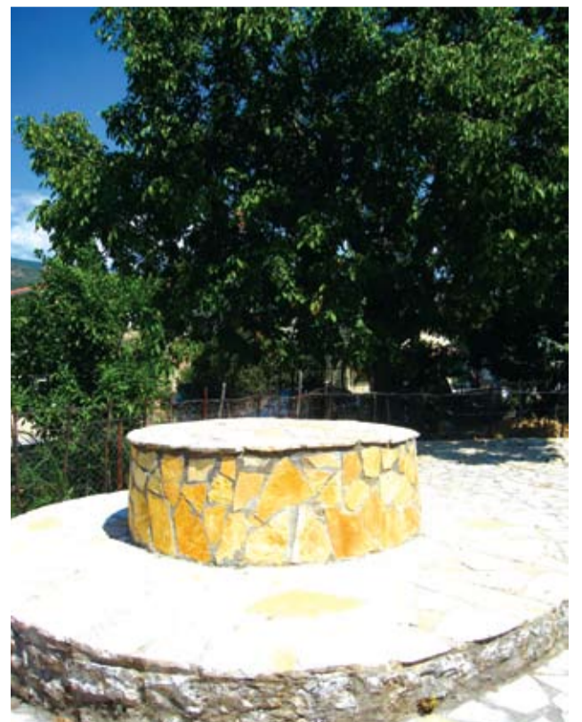
Το πηγάδι Καλαμάκι-Κοντογιάννη

«Πολλά από τα πηγάδια υπάρχουν και σήμερα στις αυλές, αλλά ως διακοσμητικά κυρίως. Αρκετοί τα έκλεισαν με τσιμεντένια πλάκα και απαγορεύεται η χρήση τους γιατί τα υπόγεια νερά έχουν μολυνθεί από τους