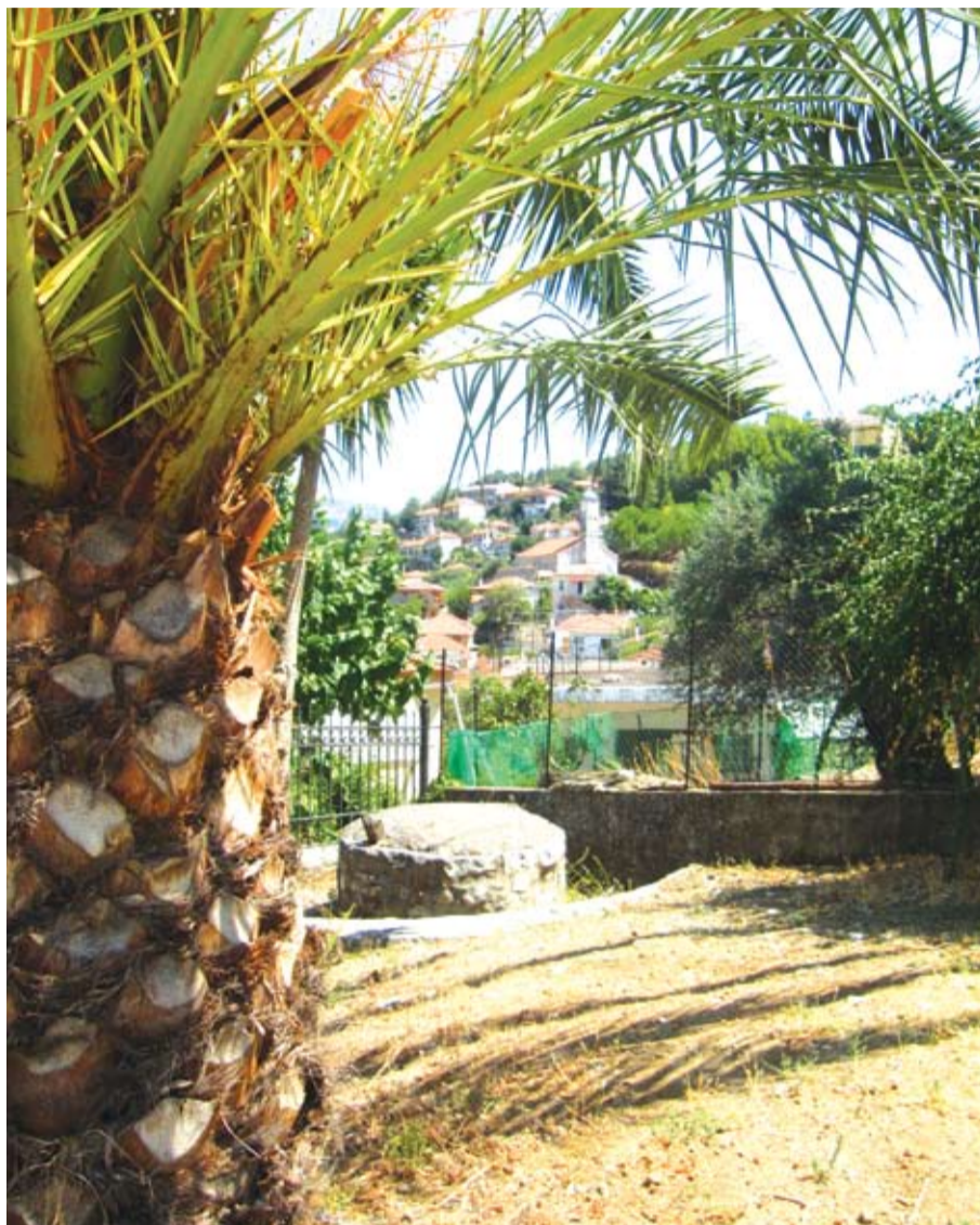
Το πηγάδι του Μπεζαίτη που ήταν και το πιο βαθύ (κάπου 35 μέτρα)