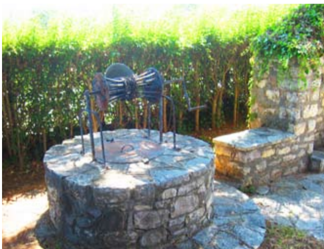
Το πηγάδι του Αυγεράκη

επισημαίναμε τον τόπο και στη συνέχεια σκάβαμε με κασμά και φτυάρι έναν ρηχό λάκκο σε σχήμα κύκλου. Στο 1-1,5 μέτρο βάζαμε ένα μαγγάνι (βαρούλκο) στηριγμένο σε τρίποδα για να ανεβάζουμε το χώμα. Δουλεύαμε δύο εργάτες; ένας έσκαβε και γέμιζε το πανέρι με χώμα και ο άλλος το ανέβαζε με το μαγγάνι. Δυσκολία είχε το άνοιγμα σε πετρώδες έδαφος, όπως για παράδειγμα του Μπεζαίτη. Εκεί σκάψανε 27-30 μέτρα βαθιά για να βρουν νερό. Στη διάνοιξη σε τέτοια εδάφη δεν κάναμε χρήση δυναμίτη γιατί ήταν πολύ επικίνδυνο. Στη συνέχεια φτιάχναμε με ξύλα - από πλατάνι συνήθως - τετράγωνο σαν τελάρα και πάνω απ' αυτό άρχιζε το χτίσιμο εσωτερικά, από κάτω προς τα επάνω. Το συνηθισμένο βάθος ήταν 13- 15 μέτρα. Μέτρα ασφαλείας δεν παίρναμε. Για παράδειγμα δεν προστατεύαμε το κεφάλι μας όταν σκάβαμε. Μπορούσε ποσότητα χώματος ή χαλιά να μας σκοτώσει, αν έπεφτε πάνω μας. Παίζαμε τη ζωή μας κορώνα γράμματα.»