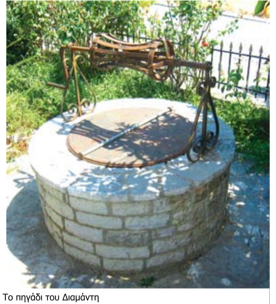
Το πηγάδι του Διαμάντη

Γιαυτό χρειάζεται πάντοτε προσοχή και σύνεση στη διαχείρισή του γιατί δεν είναι ανεξάντλητος φυσικός πόρος και όπως λέγεται ο τρίτος παγκόσμιος πόλεμος θα γίνει για τον έλεγχο του νερού.