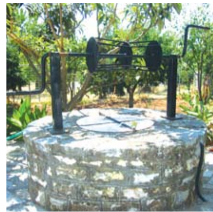
Το πηγάδι Γιαννακούρη (Πασπάλι)

πρώτες εξυπηρετούνταν και από τη βρύση στα πλατάνια, η οποία δε στερεύει ποτέ. Ακόμα κι όταν οι άλλες πηγές σταματούν, αυτή βγάζει νερό. Λέγεται ότι πιθανόν να