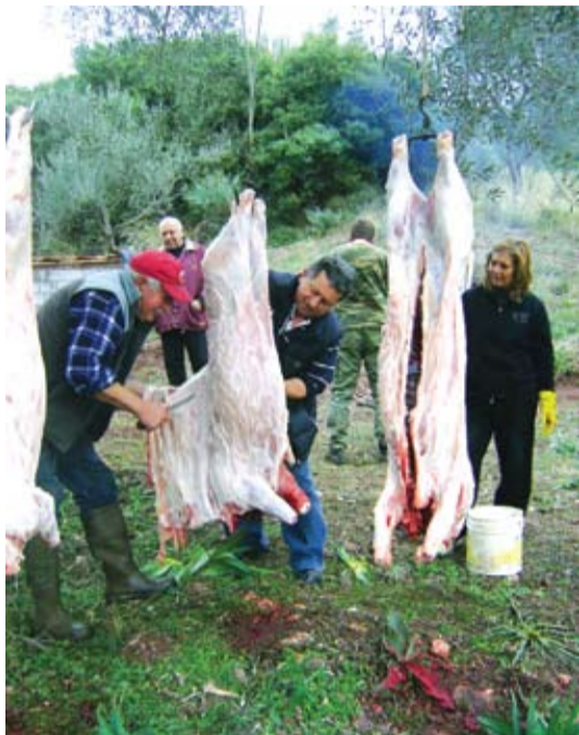
Καρδαριώτες στο παραδοσιακό σφάγιο των γουρουινών τα Χριστούγεννα

Ίδια εικόνα και στο χωριό. Πολλοί συγχωριανοί μας ήρθαν στην Αθήνα για να γιορ-