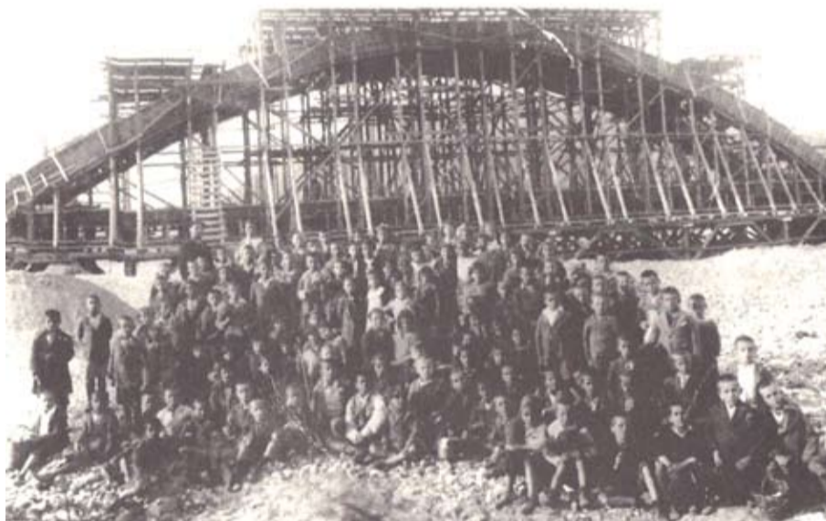
Εκδρομή μαθητών σχολείων το 1937 στο εργοτάξιο της Γέφυρας