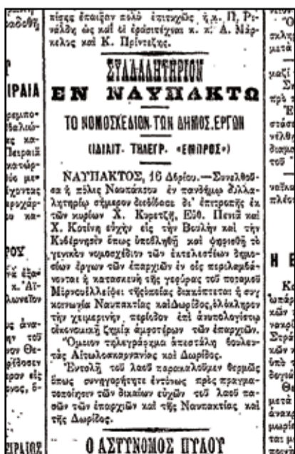
Η εφημερίδα ΕΜΠΡΟΣ του 1907 με το ρεπορτάζ με το συλλαλητήριο για την κατασκευή της γέφυρας.