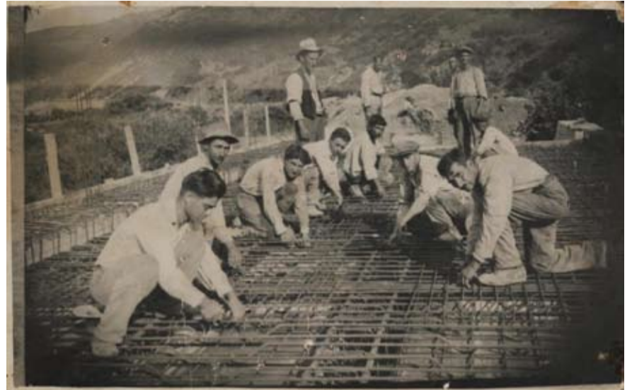
Εργάτες κατασκευάζουν τη γέφυρα το 1937

Το αίτημα της γεφύρωσης του Μόρνου πήρε πολλά χρόνια μέχρι να γίνει πραγματικότητα και αφού συνέβησαν πολλά περιστατικά πνιγμού. Όπως αναφέρει η εφημερίδα ΕΜΠΡΟΣ(17-12-1907): στις 16 Δεκεμβρίου 1907, προφανώς μετά από κάποιο συμβάν πνιγμού, «συνελθούσα η πόλις Ναυπάκτου εν πανδήμω συλ-