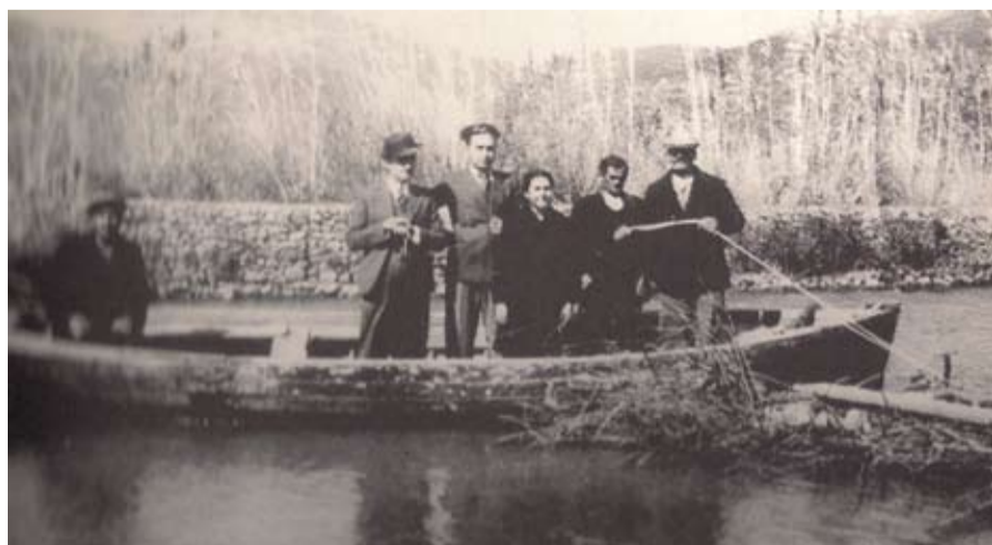
Το πέρασμα του ποταμού τη δεκαετία του 1930 με βάρκα

Ο Ευπαλιώτης ιατρός Γιάννης Τριανταφύλλου, έχοντας ο ίδιος σχετικά βιώματα, σε βιβλίο του γράφει για τη διαδρομή Ευάλιο-Ναύπακτο: «Αυτό το «δέκα χιλιόμετρα μακριά» από το χωριό μας, με τα σημερινά δεδομένα μοιάζει λίγο με αστειό. Τότε, όμως, δεν υπήρχαν δρόμοι, συγκοινωνία. Στη Ναύπακτο πηγαίναμε ή με τα πόδια ή με τα άλογα. Κι ανάμεσα στο χωριό μας (σε όλα τα χωριά της Δωριδας) και στη Ναύπακτο υπήρχε ένα φοβερό εμπόδιο. Ο ποταμός Μόρνος, χωρίς γέφυρα τότε. Τους χειμωνιατικούς μήνες ο Μόρνος με τις κατεβασίες του ήταν αδιάβατος. Ήταν αδύνατο και πολύ επικίνδυνο να τον περάσουμε. Μόνο πολύ τολμηροί που είχαν δυνατά άλογα, το αποφάσιζαν. Οι άλλοι και κυ-