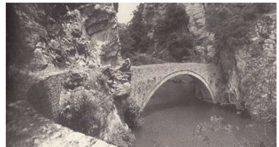
Το ιστορικό Κεφαλογιόφυρο που διατηρείται μέχρι σήμερα

ναί 6 μέτρα. Είναι κατασκευασμένη με σιδηροπαγές μπετόν-αρμέ. Στοιχίσε 10 εκατομμύρια δραχμές, τα οποία καταβλήθηκαν από το κράτος ως μέρος της δαπάνης για την κατασκευή της εθνικής οδού Πειραιώς-Μεσολογγίου. Η σημασία της για την οικονομική και κοινωνική ανάπτυξη της περιοχής ήταν καταλυτική. Επίσης είχε και μεγάλη στρατιωτική σημασία.