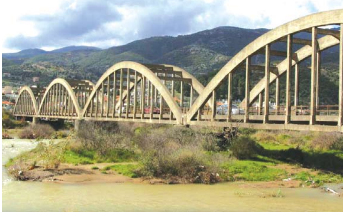
Η γέφυρα του Μόρνου στη σημερινή της μορφή

Το «Κεφαλογιόφυρο» συνδέει την ορεινή Δωριίδα και την ορεινή Ναυπακτία. Είναι χτισμένο σε ένα στενό πέρασμα του Μόρνου και είχε πολύ μεγάλη σημασία για την ζωή της περιοχής. Χτίστηκε τα χρόνια της Τουρκοκρατίας. Είναι μονότοξο, έχει μήκος δεκάξι μέτρα, πλάτος 2,30 μέτρα και απέχει πέντε μέτρα από την επιφάνεια του νερού. Από εκεί πέρασαν οι υπερασπιστές του Μεσολογγίου μετά την ηρωική Έξοδο. Οι περισσότεροι από αυτούς κατοίκησαν στα χωριά της Δωριίδας, της Ναυπακτίας και της Παρνασσίδας. Πολλοί προτίμησαν την Καρυά για νέα τους πατρίδα.