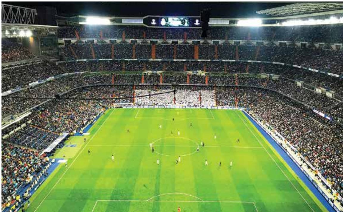
Το στάδιο Μπερναμπέου της Ρεάλ Μαδρίτης

* Ο Ανδρέας Μαζαράκης είναι δημοσιογράφος σε εφημερίδες και Ρ/Φ