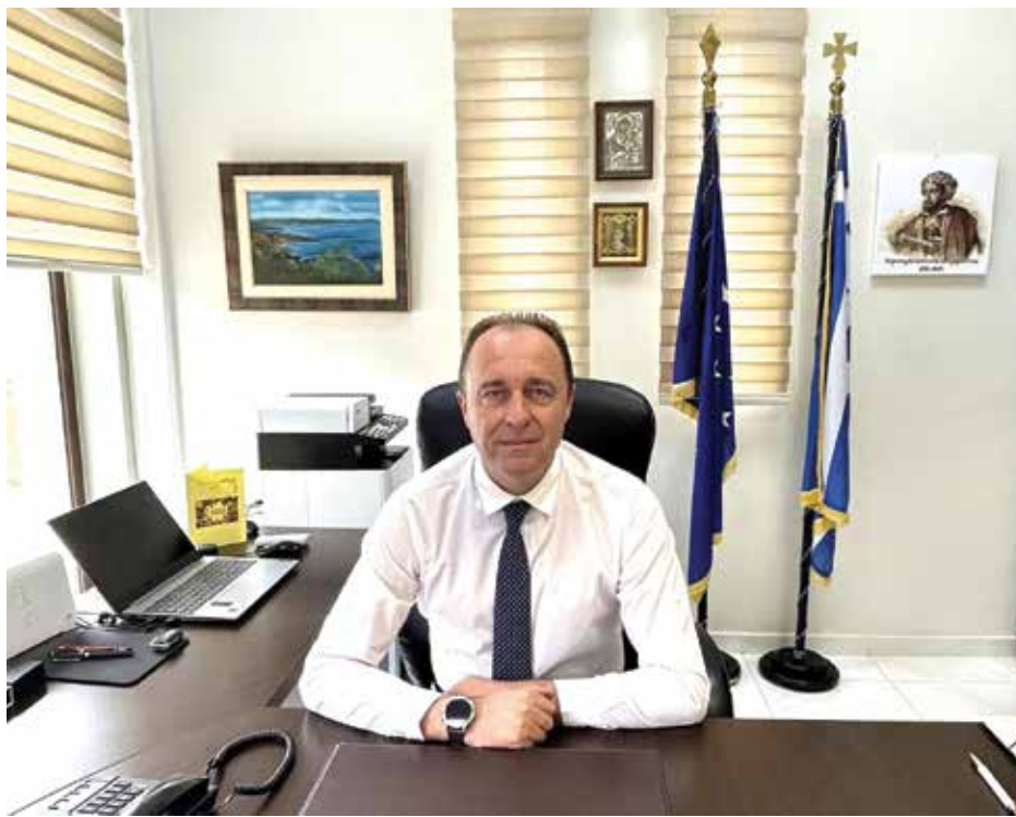
ο Δήμαρχος Δωρίδος, Δημήτρης Γιαννόπουλος

δημοτικής περιόδου και τους μεταβιβάζει τις εξής αρμοδιότητες :