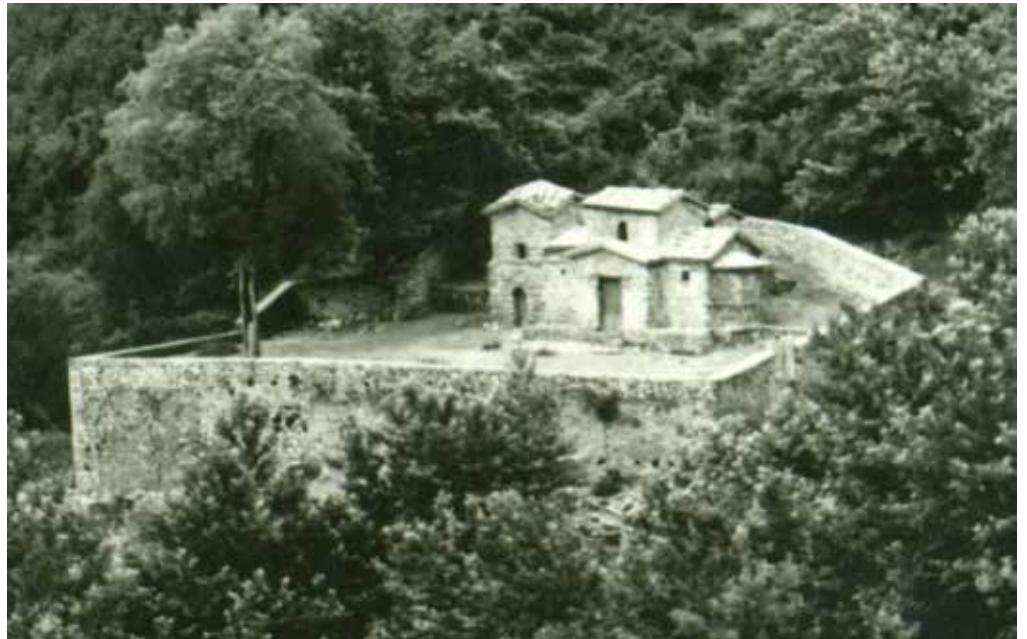
Ο Αϊ Γιάννης Ευπαλίου 1000 ετών, σε φωτογραφία του 1950

φορέων. Ας ευχηθούμε αυτή τη φορά να προκύψει κάτι θετικό από την επανεργο-