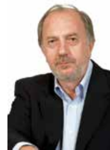
Του Κώστα Αντωνόπουλου*

Τα αποτελέσματα των εθνικών εκλογών της 21ης Μαΐου 2023 αποτυπώνονται στους τρεις πίνακες που παρατίθενται και αφορούν: