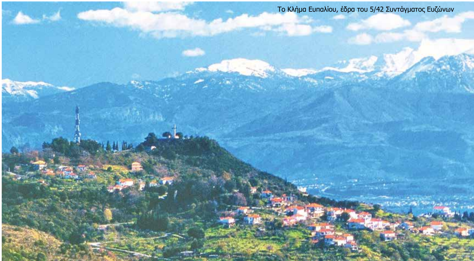
Το Κλίμα Ευπαλίου, έδρα του 5/42 Συντάγματος Ευζώνων

Φωτίζει ουσιαστικά το βιβλίο, τις εξελίξεις στη σχέση και στην σύγκρουση των δυο οργάνωσεων, του ΕΑΜ και