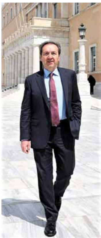
Ο βουλευτής Ιωάννης Μπούγας

Τέλος ο Ξενοφών Χαρούρας έλαβε ικανοποιητικό αριθμό ψήφων, συνεκτιμώντας το γεγονός ότι κατέβαινε για πρώτη φορά ως υποψήφιος