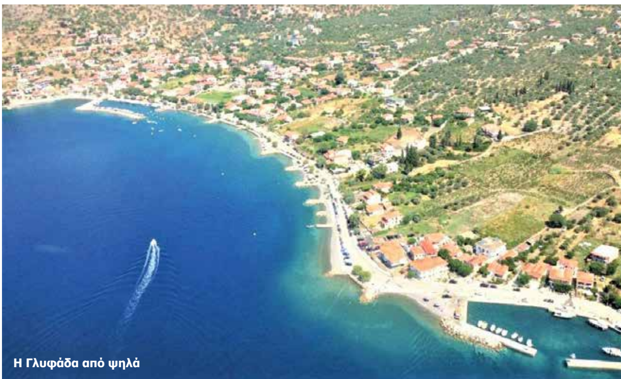
Η Γλυφάδα από ψηλά

ΟΙ μοναδικές ομορφιές της Δωρίδας, το πάντρεμα του ορεινού όγκου με τη θάλασσα, τα κουκλίστικα χωριουδάκια με τις μαγικές παραλίες... μας προκαλούν και μας περιμένουν για μια απόδραση από την καθημερινότητα. Μια άγνωστη στους πολλούς αλλά τόσο κοντινή σε αστικά κέντρα. Την ονόμασαν Δωρική Ριβιέρα και δεν είχαν άδικο. Μια παρθένα περιοχή στο βόρειο μέρος του Κορινθιακού Κόλπου, μεταξύ Ναυπάκτου και Γαλαξιδίου. Φτάνεις εδώ σε 2 ώρες από Αθήνα και Πειραιά μέσω γέφυρας Ρίου – Αντιρρίου και 2,5 ώρες μέσω Αράχωβας – Δελφών.