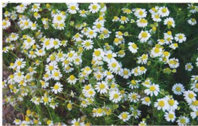
Χαμομήλι ( Matricariachamomilla L.)

Στη χώρα μας καλλιεργείται στη Στερεά Ελλάδα, Αττική, Θεσσαλία, Μακεδονία, Θράκη, και αλλού.