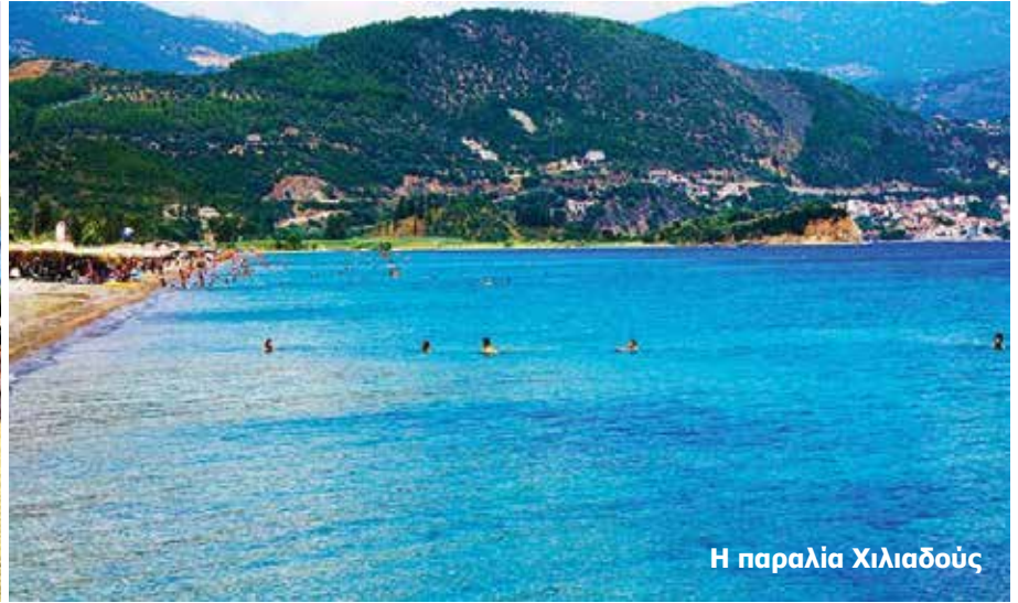
Η παραλία Χιλιαδούς