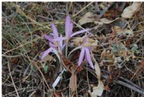
Κολχικό το ελληνικό ( Colchicum graecum )