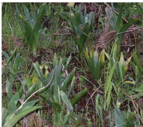
Βιότοπος του ελληνικού κολχικού στα Βαρδούσια όρη