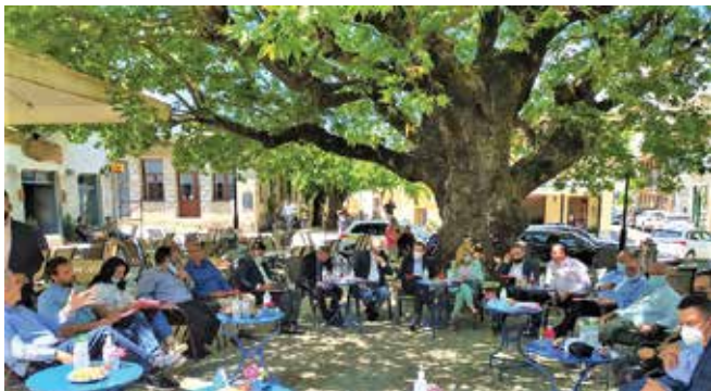
Από τη συγκέντρωση βουλευτών και Δημοτικών παραγόντων στο Λιδωρίκι

Να πούμε επίσης εδώ ότι ο Δήμος είχε τυπώσει και διένειμε ειδικό καλαίσθητο ενημερωτικό φυλλάδιο για τη Λίμνη Μόρνου και τον Παραλίμνιο.