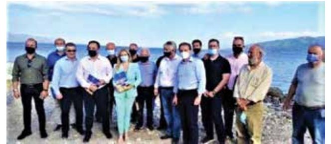
Βουλευτές και Δημοτικοί παράγοντες στη λίμνη

Η Πρόεδρος της Επιτροπής Προστασίας Περιβάλλοντος, Διονυσία Αυγερινούπουλου ανέφερε τα εξής: «Το υπόψη έργο, προϋπολογισμού περίπου 17.000.000 €, έχει τα απαραίτητα χαρακτηριστικά, ώστε να χαρακτηριστεί ως έργο Εθνικού Επιπέδου, Ειδικό και Σημαντικό, και το Υπουργείο Υποδομών και Μεταφορών έχει ετοιμάσει Απόφαση, που το χαρακτηρίζει ακριβώς έργο Εθνικού Επιπέδου και το εντάσσει στον προγραμματικό σχεδιασμό του για χρηματοδότηση