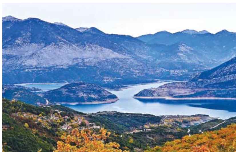
Η λίμνη του Μόρνου με τα βουνά και τα χωριά της Δωριδας

πρόβλεψη μέχρι το έτος 1984. Από τις σχετικές αναλύσεις προέκυψε ότι η ετήσια κατανάλωση θα έφτανε τα έτη 1983-84 στα 300 εκατομμύρια κυβικά μέτρα νερού περίπου.