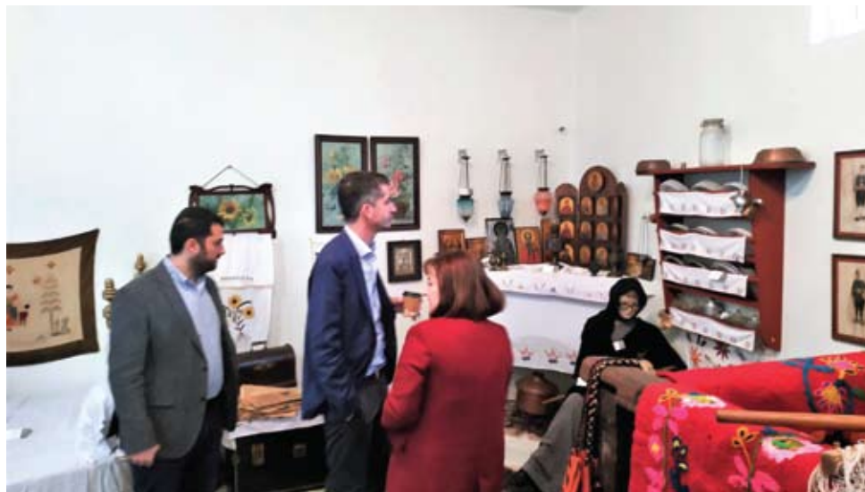
Η διευθύντρια του Μουσείου ξενάγει το Δήμαρχο Αθηναίων Κώστα Μπακογιάννη και τον Περιφερειάρχη Στερεάς Ελλάδας Φάνη Σπανό

Παρέμεινε επί μία ώρα στους χώρους του Μουσείου, συνοδευόμενος από τον νυν Περιφερειάρχη Φάνη Σπανό, όπου ξεναγήθηκαν από την Διευθύντρια του Μουσείου, καθηγήτρια Γιάννα Κατσαρού. Έχοντας μια ιδιαίτερη ευαισθησία στα πολιτιστικά όπως ανέφερε, έμεινε ιδιαίτερα ενθουσιασμένος με την οργάνωση και την μεγάλη ποικιλία εκθεμάτων που σπάνια συναντάς σε παρόμοια μουσεία. Στο βιβλίο επισκεπτών ο Κώστας Μπακογιάννης έγραψε: «Μια ανάσα πολιτισμού, μια όαση ζωής, η οποία τιμάει την ιστορία, την παράδοση και τον πολιτισμό μας. Ένα μουσείο πραγματικό πρότυπο. Θερμές ευχαριστίες που το μοιραστήκατε μαζί μας». Επίσης ο Περιφερειάρχης Φάνης Σπανός έγραψε: «Θερμά, θερμότατα συγχαρητήρια για το Λαογραφικό Μουσείο Ευπαλίου!! Τεράστια σημασία παρακαταθήκη για την ιστορία, τον πολιτισμό, τα παιδιά μας...»