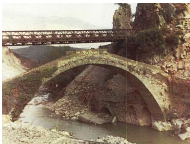
Τα νερά του Μόρνου που κυλούσαν κάτω από το παλιό γεφύρι και τη σιδερένια γέφυρα του Στενού που τώρα είναι σκεπασμένα από τα νερά της λίμνης

μέτρων. Η χωρητικότητα της λίμνης είναι 764 εκατομμύρια κυβικά μέτρα, με συνολική επιφάνεια 19,9 τετραγωνικά χιλιόμετρα. Έχει περίμετρο 60 χιλιόμετρα και είναι σχεδόν ίση με την περίμετρο της μεγαλύτερης λίμνης της Ελλάδας, την Τριχωνίδα.