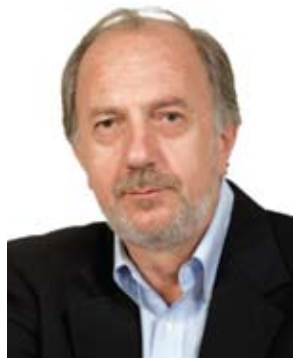
Άρθρο του Κωνσταντίνου Αντωνόπουλου*

1. Στην τοπική οικονομία, από το ασφυκτικό πλαίσιο των περιοριστικών όρων που έχουν επιβληθεί, χωρίς επιστημονική τεκμηρίωση, σε ακτίνα 1.500 μέτρων περιμετρικά