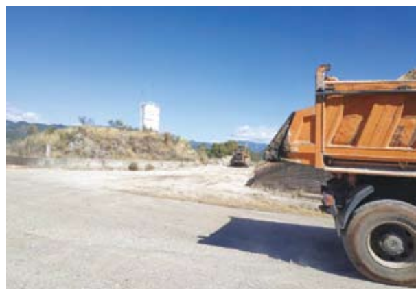
(1) κάθετη οδό – (Επαρχιακή) και τέσσερις (4) παράπλευρους δρόμους.