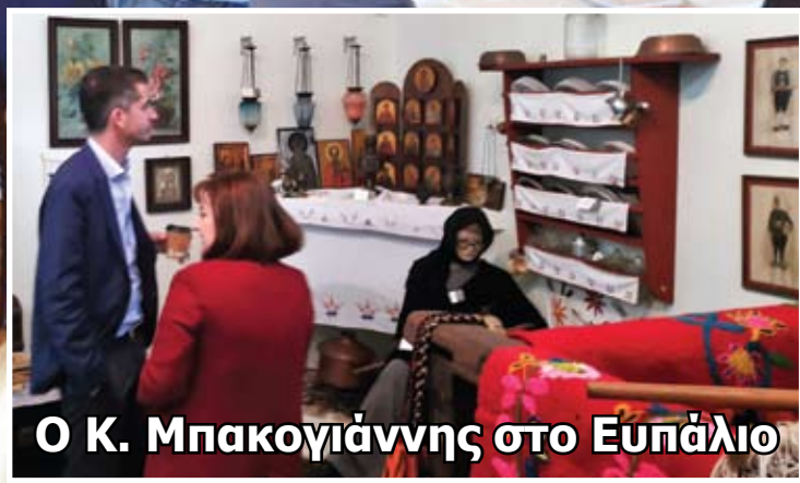
Ο Κ. Μπακογιάννης στο Ευπάλιο