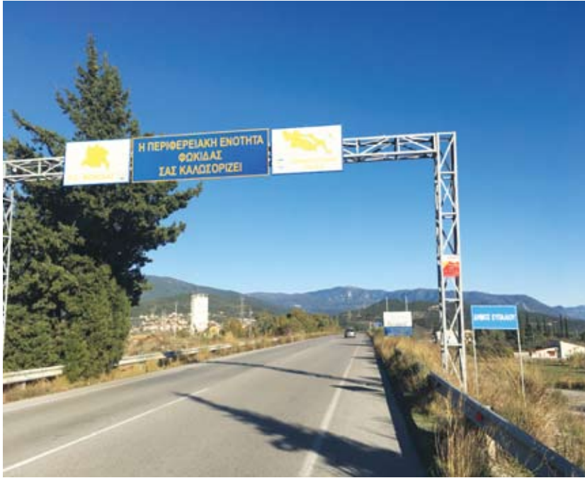
Το σημείο της παραλιακής Εθνικής Οδού Δωρίδας που θα γίνει ο κόμβος των Μαλαμάτων

Η έγκριση των περιβαλλοντικών όρων έρχεται μετά από πολύ κόπο και απίστευτη γραφειοκρατία, τον Οκτώβριο του 2018. Ο Γολγοθάς και η γραφειοκρατία για το έργο έφτασε επιτυχώς στο τέλος του, μετά την καθημερινή παρακολούθηση και επέμβαση σε κάθε δυσκολία που συναντούσε η μελέτη, του ίδιου του Περιφερειάρχη του