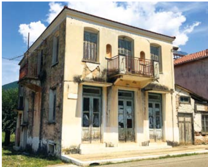
Το σπίτι που γεννήθηκε ο Νίκος Τριανταφύλλου στο Ευπάλιο

Στις αρχές Μαΐου 1947 έγινε αρχηγός του Αρχηγείου Φθιωτιδοφωκίδας. Δούλεψε σκληρά, σε συνθήκες αφάνταστα δύσκολες για το λαό και τους αγωνιστές της Εθνικής Αντίστασης, στο χώρο της Ρούμελης και της Μακεδονίας. Πήρε μέρος σε δεκάδες μάχες αυτής της περιόδου και απέδειξε τα αναμφισβήτητα στρατιωτικά