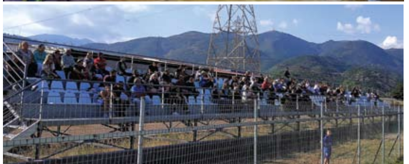
Μεγαλύτερη στήριξη από τους φιλάθλους ζητούν οι άνθρωποι του Απόλλωνα