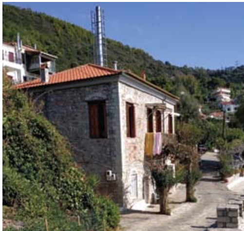
Το σπίτι της Ελένης Λιάκου στο Μοναστηράκι