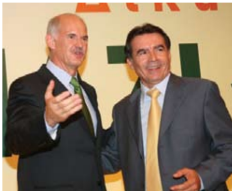
Ο Θανάσης Χαντάβας με τον Προθυπουργό Γιώργο Παπανδρέου

Ο Θανάσης είναι εξαίρετος άνθρωπος. Έχει αγαπήσει το Ευπάλιο και τους ανθρώπους του και το επισκέπτεται συχνά μαζί με τους γιους του. Επίσης δίνει το παρόν στις εκδηλώσεις και τις δραστηριότητες της Ένωσης μας. Η εφημερίδα μας τον συγχαίρει θερμά και του εύχεται κάθε επιτυχία στην αποστολή του.