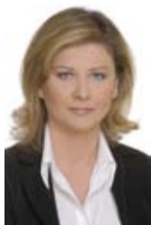
Η κα Αφροδίτη Παπαθανάση

Αρκετές ήταν οι εκπλήξεις που μας επιφύλασαν οι τελευταίες βουλευτικές εκλογές τόσο στο Ευάλιο όσο και στη Φωκίδα. Οι κυριότερες απ αυτές ήταν η εκλογή βουλευτού γυναίκας της κας Αφροδίτης Παπαθανάση, για πρώτη φορά στην ιστορία της Φωκίδας, η συμμετοχή γυναίκας της κας Ιωάννας Γκελεστάθη, στα ψηφοδέλτια της Νέας Δημοκρατίας, για πρώτη φορά και η ανατροπή του πολιτικού σκηνικού με την πρωτιά του ΠΑΣΟΚ, παρά το αντίθετο που έδειχναν όλες οι