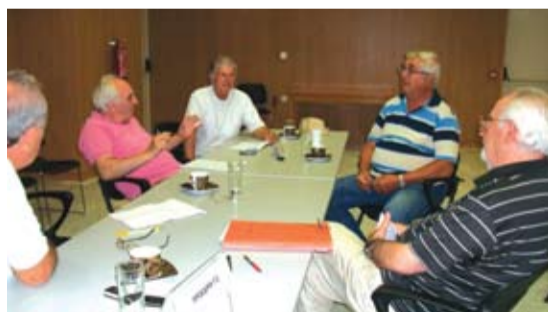
Η ίδρυση «ΕΠΙΤΡΟΠΗΣ ΦΙΛΩΝ» του Βυζαντινού Ι.Ν.Αγίου Ιωάννη (Αγ. Νικόλαος) Ευπαλίου, για την αναστήλωσή του, σε πρώτη συνεδρίαση

αστικών φορέων και των Εφορειών βυζαντινών αρχαιοτήτων για την αναστήλωσή του, διότι έπρεπε πρώτα να συνταχθεί η οριστική μελέτη εκ μέρους ειδικού τεχνικού γραφείου μηχανικών, ειδικευμένων στην οικοδομική αναστήλωση, και συντήρηση των τοιχογραφιών, αποφασίστηκε η ίδρυση μιας εντεκαμελούς «ΕΠΙΤΡΟΠΗΣ ΦΙΛΩΝ» του Αγ. Ιωάννη, υπό την αιγίδα της Ένωσης Ευπαλιωτών και