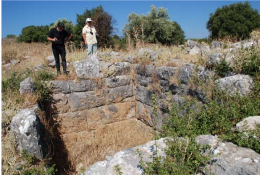
Μερικά από τα θαμμένα τείχη της Ακρόπολης

Ευπαλίου. Έχουν περάσει σχεδόν 5 χρόνια και δεν έχει γίνει τίποτα από τον δήμο Ευπαλίου. Πρόσφατα επισκέφτηκα το χώρο με αφορμή (παρακίνηση) του 10χρονου γιου μου. Έχει διαβάσει τόσα από το βιβλίο για το τόπο μας που ήθελε να εξερευνή-