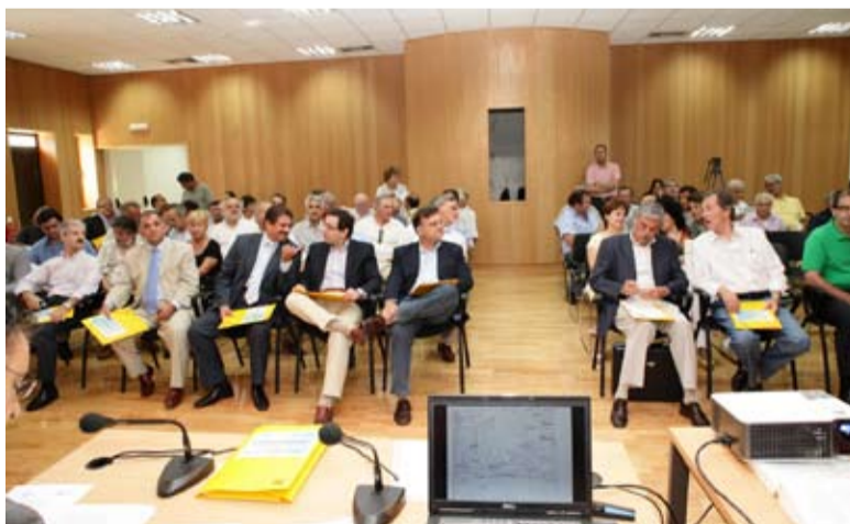
Εκπρόσωποι των φορέων που συμμετείχαν στην Ημερίδα