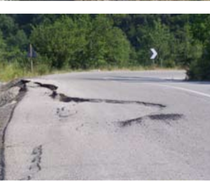
Αυτό λέγεται Εθνική Οδός στη Φωκίδα του 21ου αιώνα.

ανθρώπινη παρέμβαση, αλλά η διαδρομή είναι αρκετά κουραστική και επικίνδυνη, δηλαδή αναδεικνύουν την ουσία του προβλήματος... Η βελτίωση και ο εκσυγχρονισμός του οδικού άξονα, γέφυρα Μόρνου μέχρι το Λιδωρικό, και από Ρέρεση, θα μπορούσα να πω μέχρι την Άνω Χώρα, θα δώσει νέα διάσταση στην αναπτυξιακή πορεία των ορεινών όγκων, βελτίωση της ανταγωνιστικότητας