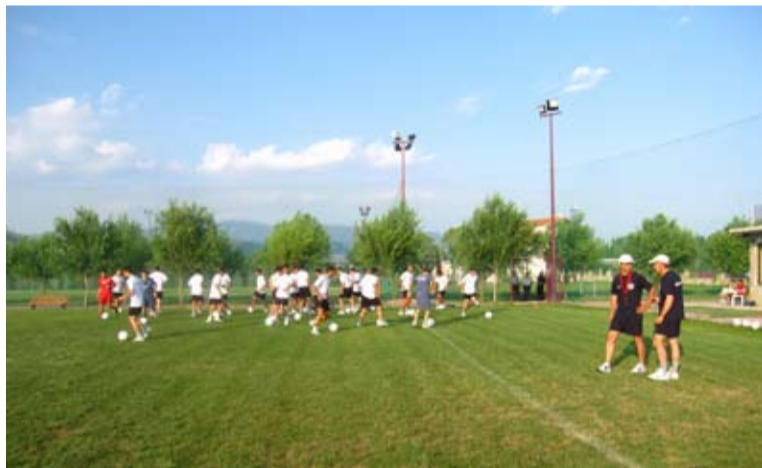
Η καθημερινή προετοιμασία του καλοκαιριού για ένα μήνα ήταν επιπέδου ανώτερης κατηγορίας και το προπονητικό team πιστεύει ότι τα αποτελέσματα θα φανούν σύντομα.

Όσον αφορά τα εισιτήρια διαρκείας έχουμε διαθέσει περίπου 100 από τα 300 που έχουμε βγάλει, αλλά σ' αυτό παίζει μεγάλο ρόλο και το θέμα του γηπέδου. Τέλος είναι πολύ σημαντική και η βοήθεια του Δήμου, καθώς έχει αναλάβει όλες τις μετακινήσεις εκτός έδρας, ενώ δεν αποκλείεται να υπάρξει κι άλλη ενίσχυση».