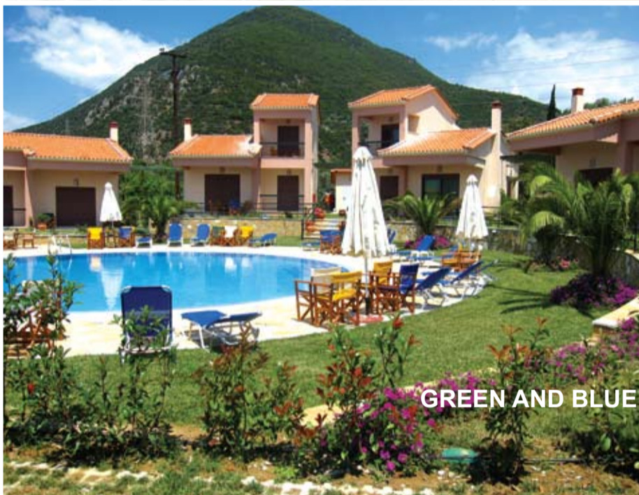
GREEN AND BLUE