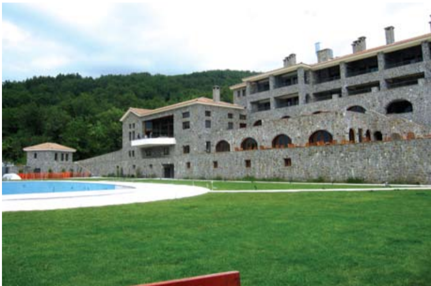
Θυμίζει ξενοδοχείο από τις Ελβετικές Άλπεις το DASOS THERETRON

Π ριν λίγα χρόνια δεν θα το φανταζόταν κανείς ότι θα μπορούσε να δημιουργηθεί στα βουνά της Δωρίδας ένα ξενοδοχείο τόσο υψηλών προδιαγραφών που να θυμίζει αντίστοιχα αυτά των Άλπεων της Αυστρίας και της Ελβετίας. Σε υψόμετρο 1000 μέτρων, ανάμεσα σε δάσος από κάθε λογής δένδρα, στην αγκαλιά των ελάτων του βουνού Τρικορφο, στήθηκε ένα πραγματικό στολίδι, ένα αρχοντικό ξενοδοχείο, από πέτρα και ξύλο, με μεράκι και φαντασία, σε μια ειρηνική συνύπαρξη με το πανέμορφο φυσικό κάλος του ορεινού δωρικού τοπίου.