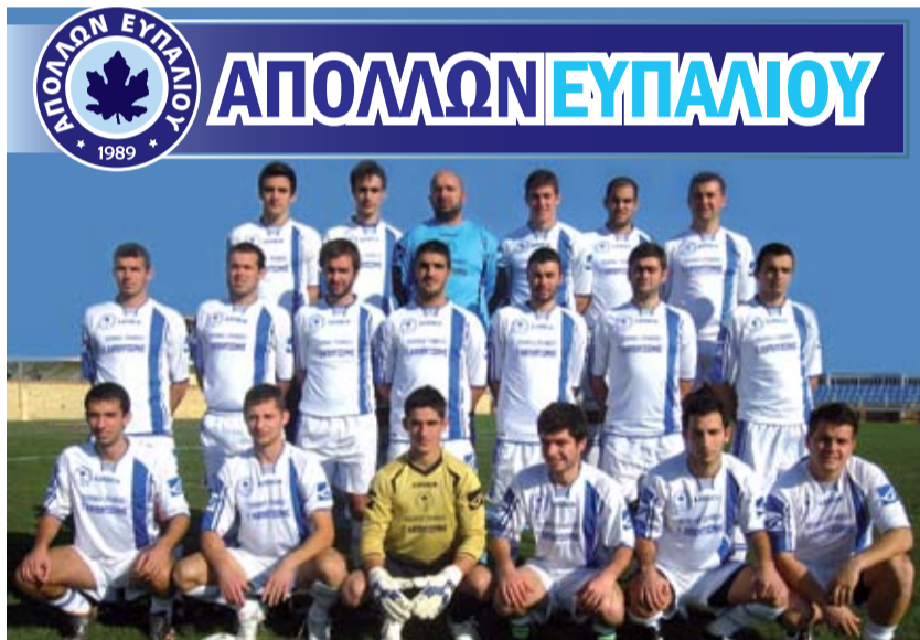
Αρκετοί από τους παίκτες του Απόλλωνα αναμένεται να «μετακομίσουν» στους Δωριείς

ομάδα. Θα κατέβει κανονικά στο τοπικό και ανάλογα με το ρόστερ, δηλαδή ποιοι θα φύγουν και ποιοι θα μείνουν, θα βάλουμε κάτω τα πράγματα και θα δούμε αν θα πρωταγωνιστήσουμε ή αν θα προσπαθήσει μείνει στην κατηγορία», ενώ σχετικά με τους παίκτες τόνισε: «Κάποια παιδιά που είναι χρόνια στην ομάδα, δεν θα τους κόψουμε το μέλλον. Για κάποιους, όμως η ομάδα έχει ξοδέψει κάποια χρήματα και προφανώς θα ζητήσει κάποιο αντάλλαγμα για να τους αποδεσμεύσει. Έτσι είναι το σωστό».