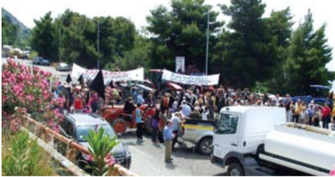
Η συγκέντρωση στον κόμβο Μοναστηρακίου

Σαν κεραυνός εν αιθρία έπεσε η είδηση μεσάνυχτα, ότι στην αρμόδια Επιτροπή της Βουλής έγινε... "καλλικρατικό πραξικόπημα", και ουσιαστικά μόνο στη Δωρίδα απ' όλη την Ελλάδα προχώρησαν στην αλλαγή έδρας του νέου Δήμου, από το Ευπάλιο στο Λιδορίκι. Υπήρξε άλλη μια περίπτωση στη Μακεδονία, όπου η έδρα πήγε στο μεγαλύτερο Δήμο της Σιάτιστας από τη Νεάπολη που είχε ορισθεί, αλλά μετά και την σύμφωνη γνώμη και των 5 βουλευτών του ΠΑΣΟΚ και της ΝΔ στο Νομό Κοζάνης.