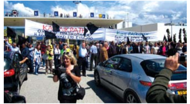
Η συγκέντρωση στη γέφυρα Ρίου - Αντιρρίου

Παράλληλα, πραγματοποιήθηκαν δύο ανοιχτές συγκεντρώσεις στο Δημαρχείο για ενημέρωση των πολιτών, όπου εκδόθηκαν και δύο ψηφίσματα (τα παραθέτουμε σε άλλη στήλη). Αποφασίστηκε και έκλεισε για λίγες ώρες η εθνική οδός Ευπαλίου-Ιτέας στον κόμβο Μοναστηρακίου, δύο διανοητικές ημέρες, ενώ υπήρξε και μεγάλη αυτοκινητοπομπή διαμαρτυρίας από 200 ΙΧ με μαύρες σημαίες προς τη Γέφυρα Ρίου-Αντιρρίου, όπου σηκώθηκαν πάνω που κατήγγειλαν το πραξικόπημα και οι πολίτες σταμάτησαν για λίγη ώρα την κυκλοφορία των οχημάτων στα διόδια της γέφυρας. Στο μεταξύ την ημέρα που ξεκίνησε η συζήτηση του Καλλικράτη στην ολομέλεια της Βουλής, μεγάλο πλήθος πολιτών από τη Δωρίδα ανέβηκε με πούλμαν στην Αθήνα, όπου μαζί με συμπατριώτες που διαμένουν στην Αττική συγκεντρώθηκαν για ώρες έξω από την είσοδο της