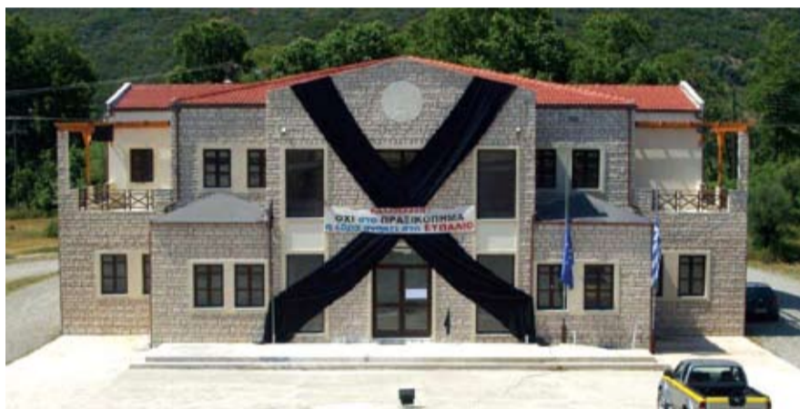
Η φωτογραφία του Δημαρχείου Ευπαλίου με τις μαύρες κορδέλες που έκανε το γύρο της Ελλάδας μέσα από τις σελίδες αθηναϊκών εφημερίδων

Όμως αυτό δεν τους το επέβαλε κανένας. Αντίθετα, η πλειοψηφία το είχε ζητήσει με την λανθασμένη, όπως και τώρα με το Δημαρχείο, δημοσιοϋπαλληλική νοοτροπία: ότι θα υπάρξουν θέσεις εργασίας κλπ κλπ, χωρίς βέ-