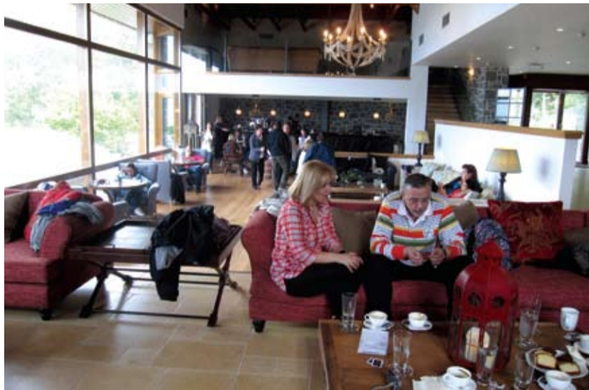
Το πολυτελές μπαρ του ξενοδοχείου με την υπέροχη θέα στα Βαρδούσια, την Γκιώνα και τα Ακαρνανικά Όρη

μας να μας τιμήσει με την παρουσία του ξανά και ξανά. Προφανώς δεν θα μπορούσαμε να μείνουμε αμέτοχοι στην προσπάθεια που γίνεται από αρκετά μεγάλο μέρος του επιχειρηματικού κόσμου για προσαρμογή των τιμών, ώστε να εξυπηρετηθούν τα νοικοκυριά που θίχτηκαν από τα πρόσφατα οικονομικά μέτρα, γι' αυτό και σε όλη τη διάρκεια του καλοκαιριού θα υπάρχουν προσφορές για πολυήμερες οικογενειακές διακοπές.